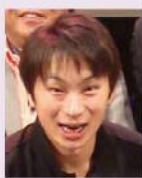
第4回S1サーバーグランプリ優勝者