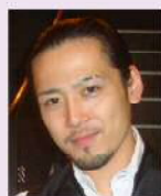
第6回S1サーバーグランプリ優勝者