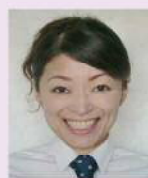
第5回S1サーバーグランプリ優勝者